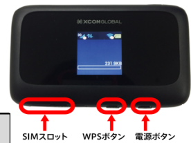
SIMスロット WPSボタン 電源ボタン